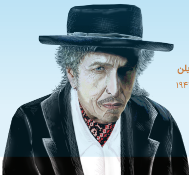
باب دیلن متولد ۱۹۴۱

تعداد کمی از مردم باران را می‌فهمند، بقیه فقط خیس می‌شوند.