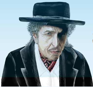
باب دیلن متولد ۱۹۴۱