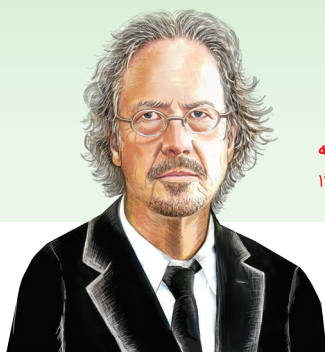
پیتر هانتکه متولد ۱۹۴۲