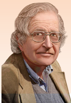
نوام چامسکی متولد ۱۹۲۸